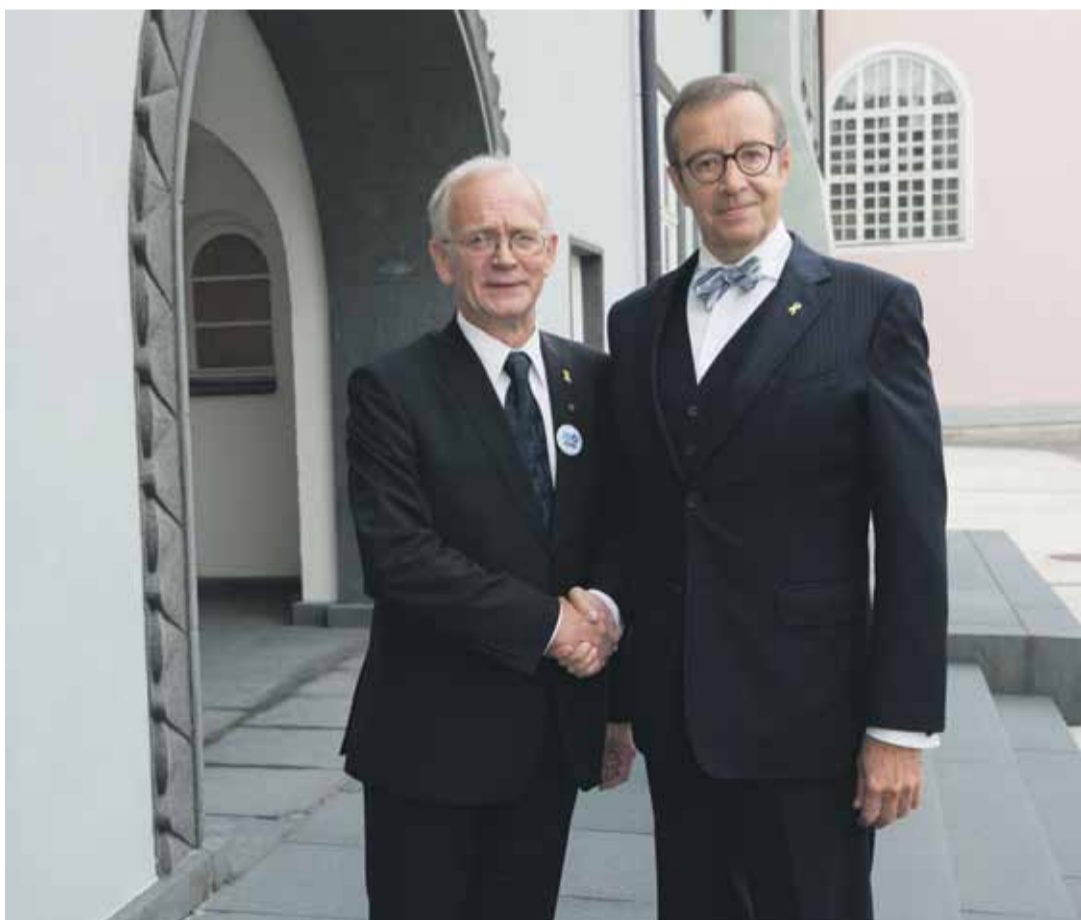
Riigikogu esimees Eiki Nestor ja president Toomas Hendrik Ilves.