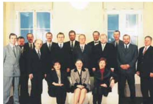
Mart Laari teine valitsus 1999. Eiki Nestor oli selles valitsuses sotsiaalminister.