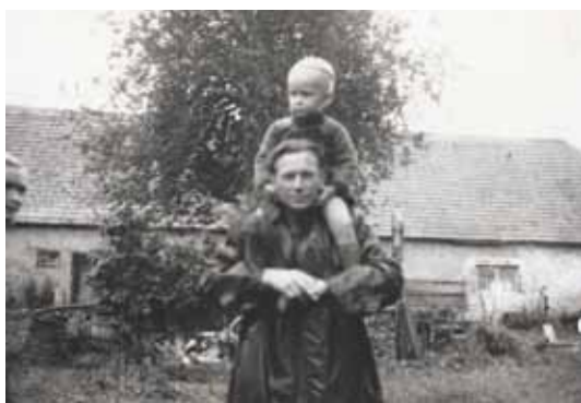
Eiki isa kukil, Anijal