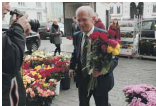
Riigikogu esimees Eiki Nestor vastu võtmas kooseluseaduse toetajate õnnitlusi