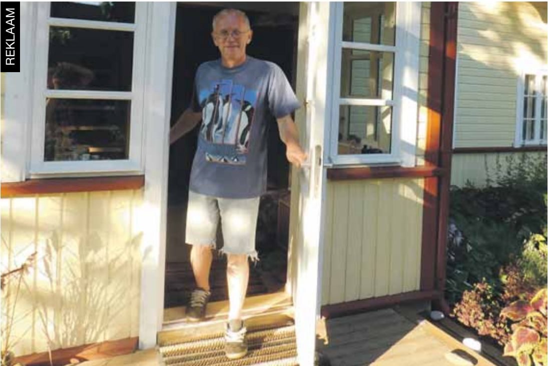
Hiiumaa kodu lävel