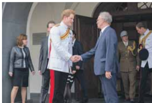
Riigikogu külastas kuninglik kõrgus prints Harry, 2014.