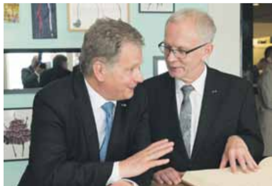
Kohtumine Soome presidendi Sauli Niinistöga, 2016.