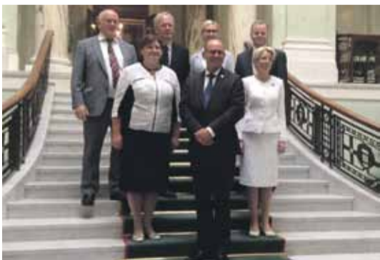
Balti- ja Põhjamaade parlamentide spiiikrite kohtumine