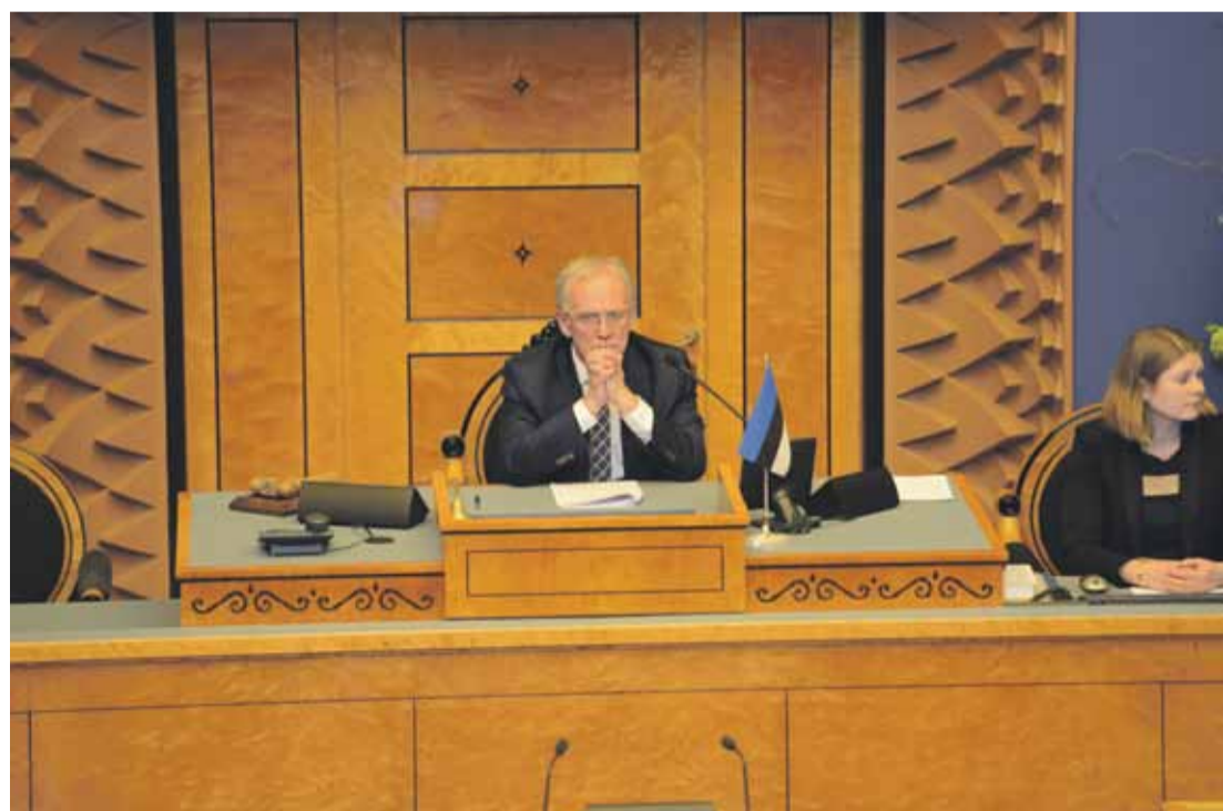
Riigikogu esimees Eiki Nestor.